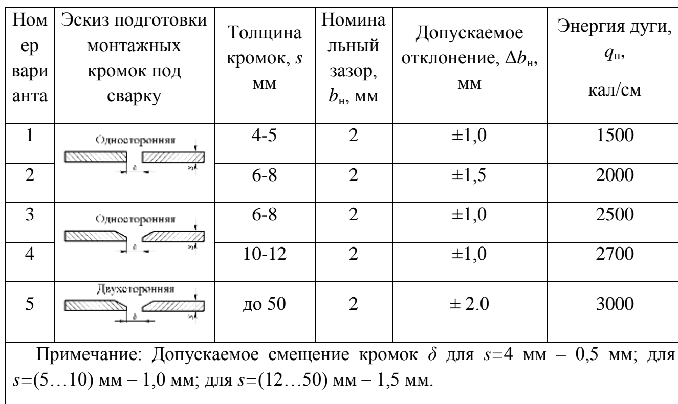
Таблица - Варианты заданий и исходные данные при сборке блоков под полуавтоматическую сварку в CO_2 и автоматическую сварку под флюсом